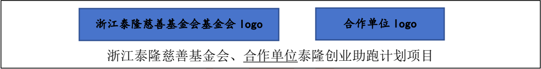
(图 2. 示例)

1) 品牌使用：每场项目活动开展时需露出项目横幅、主题背景，横幅样式可参照图 2，主题背景样式可参考图 3。